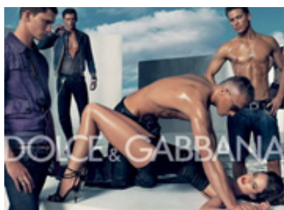
Figura 4: Dolce & Gabbana (reprodução)

“Na maioria aparecem homens e mulheres alguns assustados, outros mais descontraídos. Algumas aparecem homens “torturando” mulheres, outras aparecem pessoas paradas ou fazendo poses.” (menina, 14 anos, escola privada)