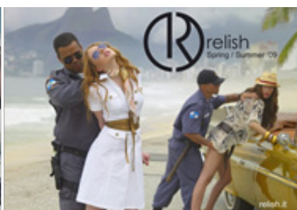
Figura 5: Relish (reprodução)