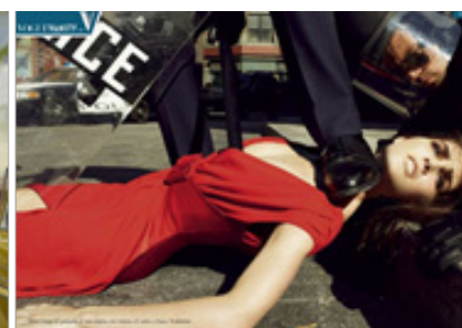
Figura 6: Vanity Vogue (reprodução)