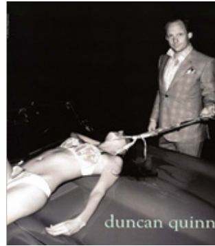
Figura 2: Duncan Quinn (reprodução)